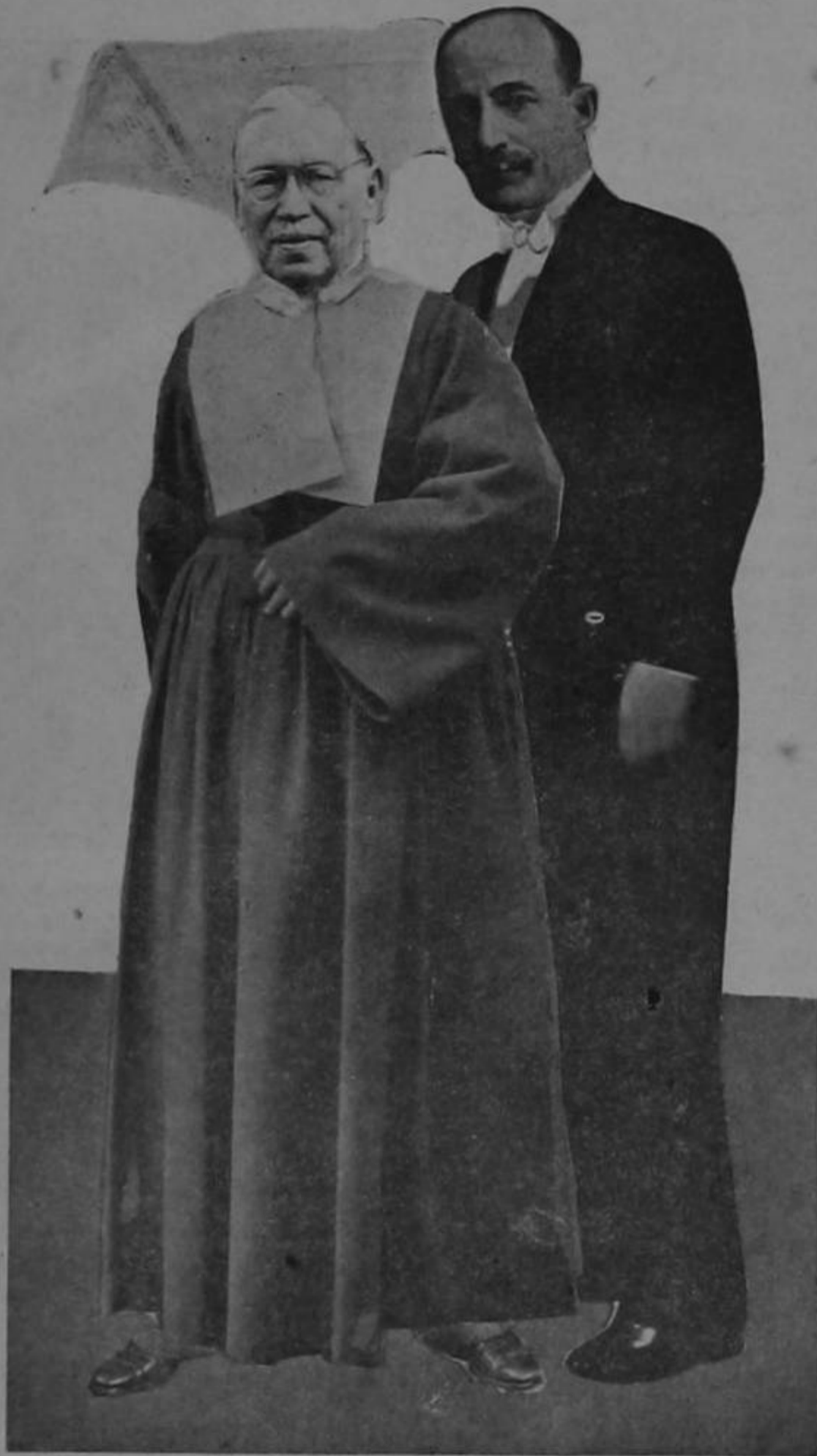
Don Alberto: Yo conozco esta monja. Es "Sor-Rita..."

(Don Alberto Echandi le pide al señor Brenes Mesén que concrete sus cargos contra el Hospital San Juan de Dios).