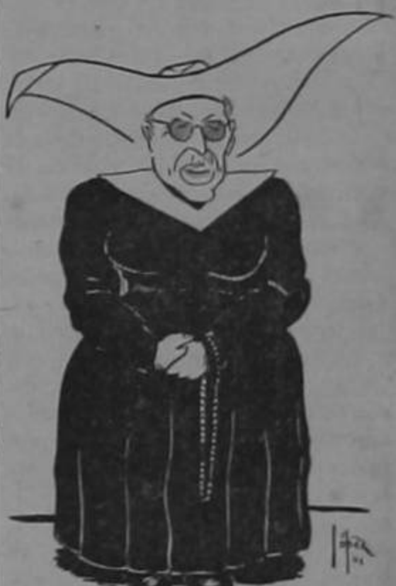
Monja que ronca, tiene mal rezol!